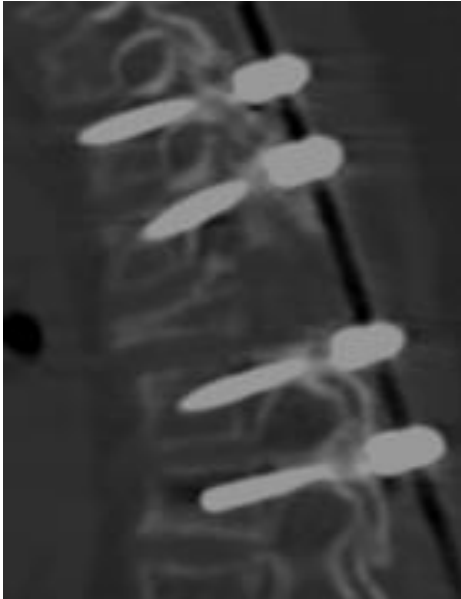
Fig. 4 Tomografía Axial en corte sagital con presencia de tornillos pediculares en niveles T2-T3 y T5-T6 con puenteo de T4

realiza diagnóstico de hipotiroidismo secundario probablemente asociado a tratamiento con radioterapia. Se decide retiro de material de osteosíntesis en el 2016 por riesgo de cifosis y efecto cigüeñal.