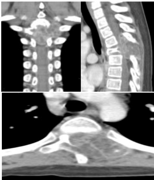
Fig.1 Cortes representativos de tomografía de columna torácica donde se observa masa tumoral a nivel de T4 que compromete elementos posteriores y conducto medular.

A su ingreso se encuentra con fuerza muscular 1/5 desde L2 a distal, hiperreflexia rotuliana y aquilea, clonus, Babinski bilateral, hipoestesia de T4 a distal, control de esfínteres presente. El 14/10/11 se realiza instrumentación pedicular T2-T3, puenteo a T4 y fijación distal T5-T6 (Fig.4). El implante seleccionado fue un sistema facetario/pedicular tipo Axon®. Se efectúa planeación quirúrgica digital mediante el uso